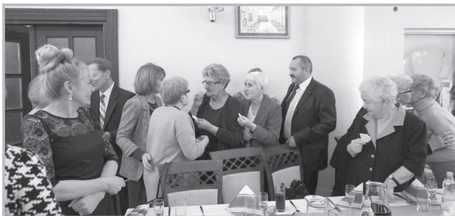
Rzeszów – spotkanie opłatkowe