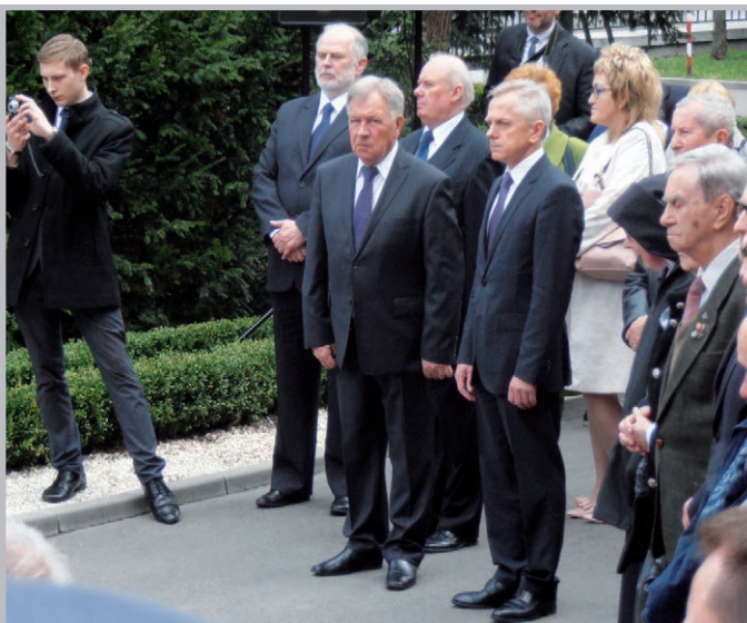
Rocznica Katyń – 2016