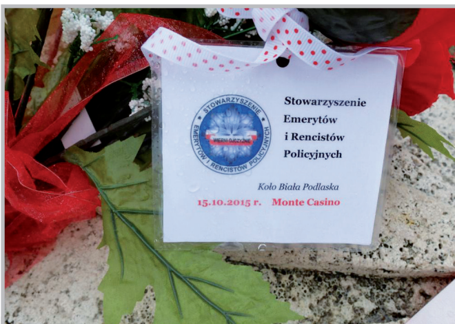
Z Białej Podlaskiej do Włoch