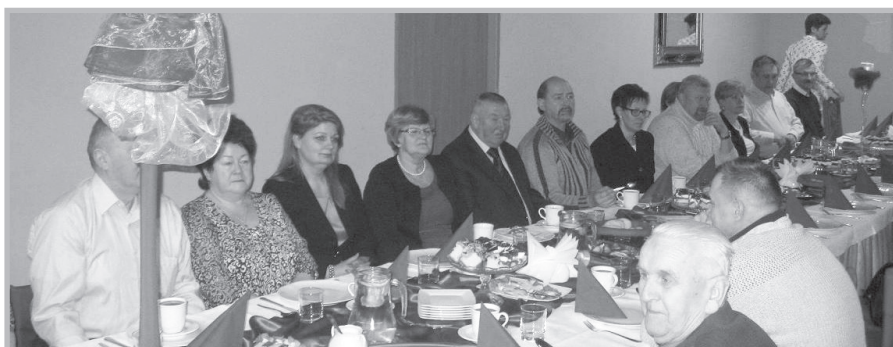
kościerzyna – zebranie integracyjne

cieczek integracyjnych planowanych przez ZW w Gdańsku na 2016 rok.