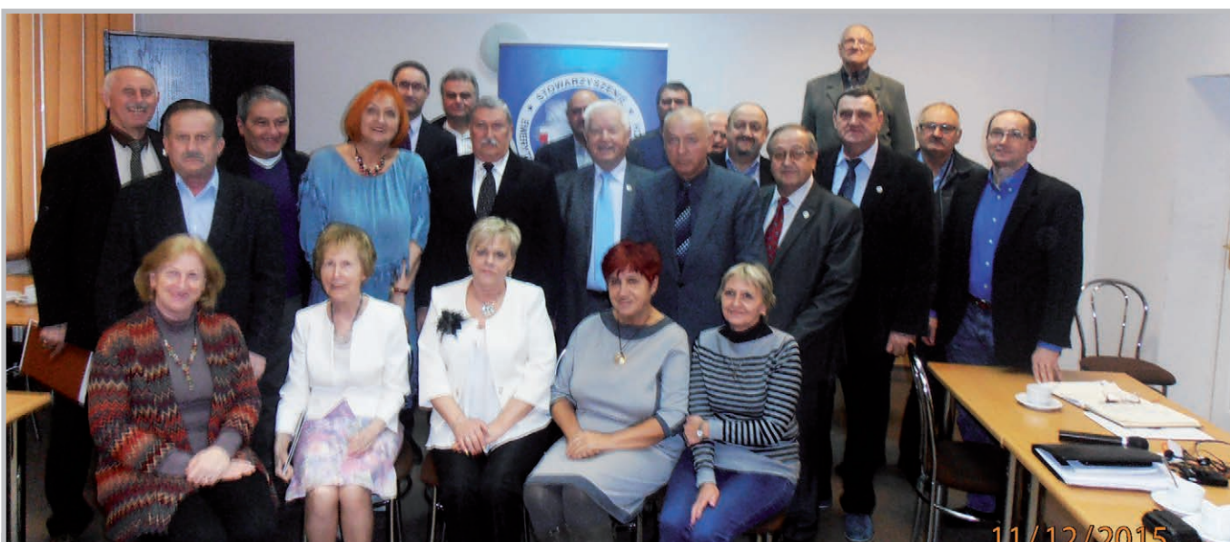
Posiedzenie plenarne ZO w Zielonej Górze