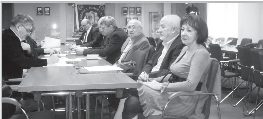
Kielce – posiedzenie ZW

Kieleckie koło mimo braku własnego lokalu zrealizowało swoje cele. Na