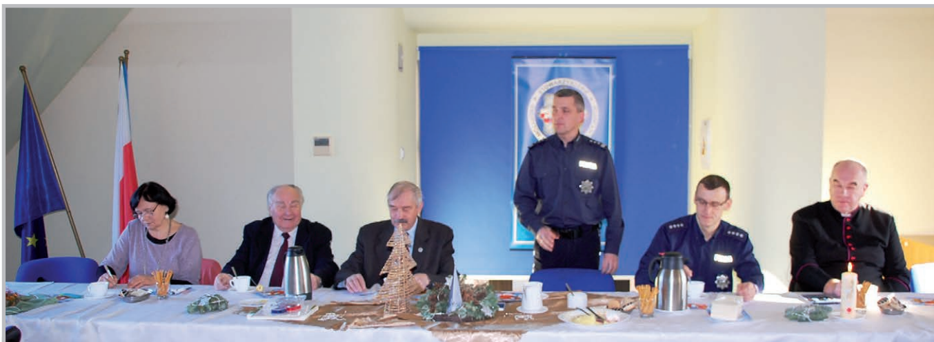
Zebranie Zarządu Wojewódzkiego w Gdańsku