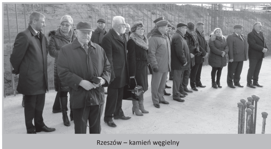
Rzeszów – kamień węgielny