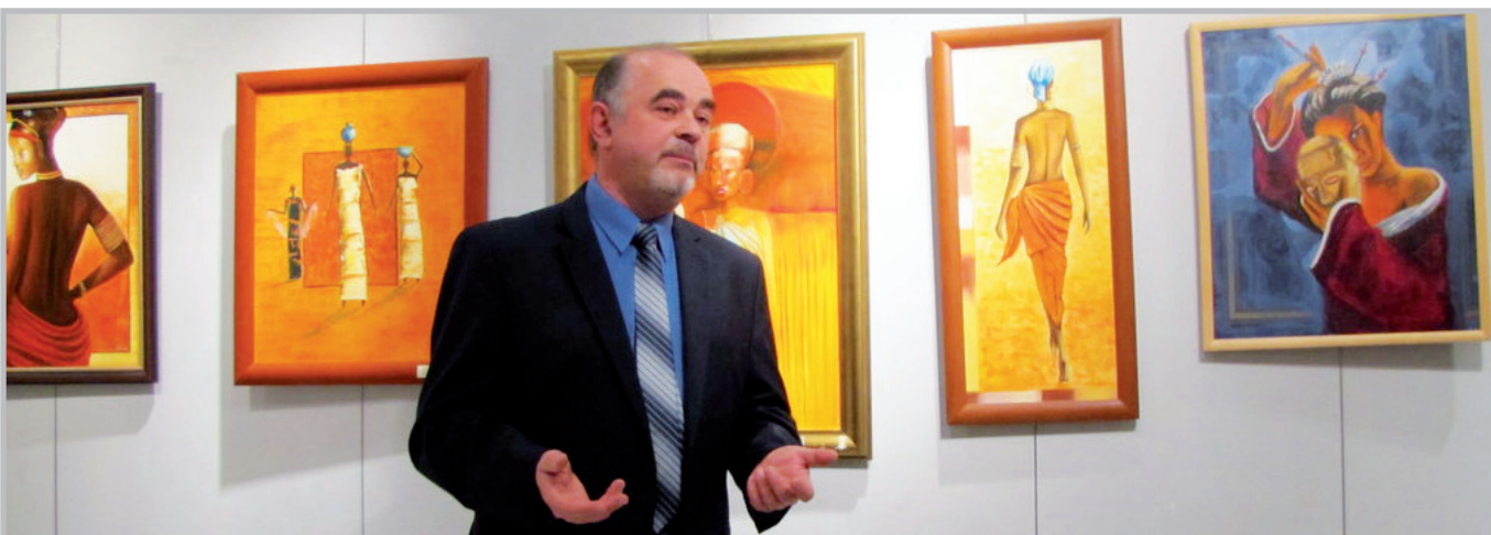
Wystawa malarstwa Krzysztofa Szali