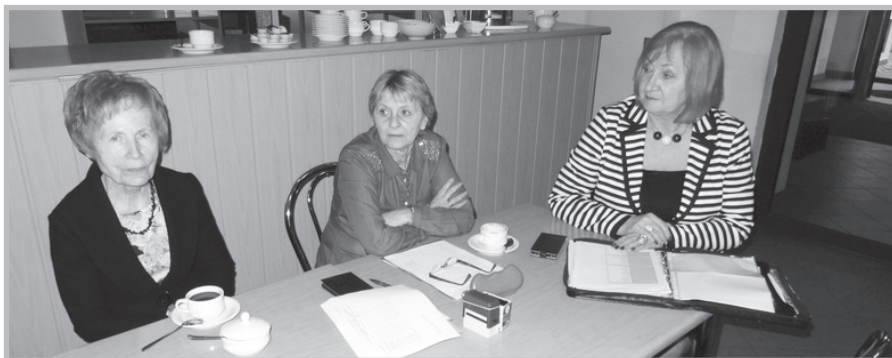
Zielona Góra – zebranie plenarne 1.04.2016