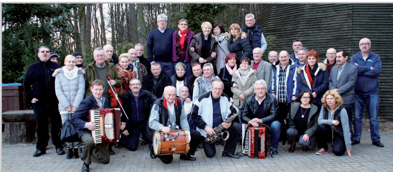
Zakończenie zimy w Kaliszu