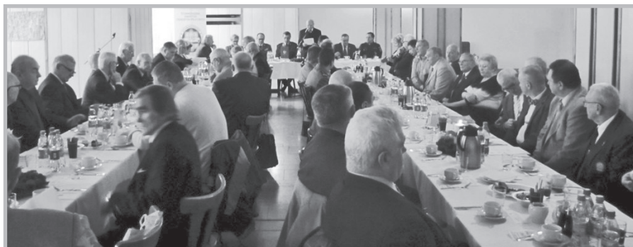
Świąteczne zebranie ZW Katowice