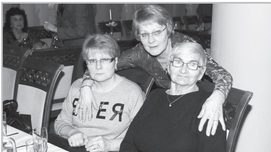
Podkarpacie – dzień Kobiet

Dzień Kobiet na Podkarpaciu. 8 marca w sali kasyna Komendy Wojewódzkiej Policji w Rzeszowie odbyło się uroczyste spotkanie z funkcjonariuszkami i pracownicami komendy z jej kierownictwem: komendantem