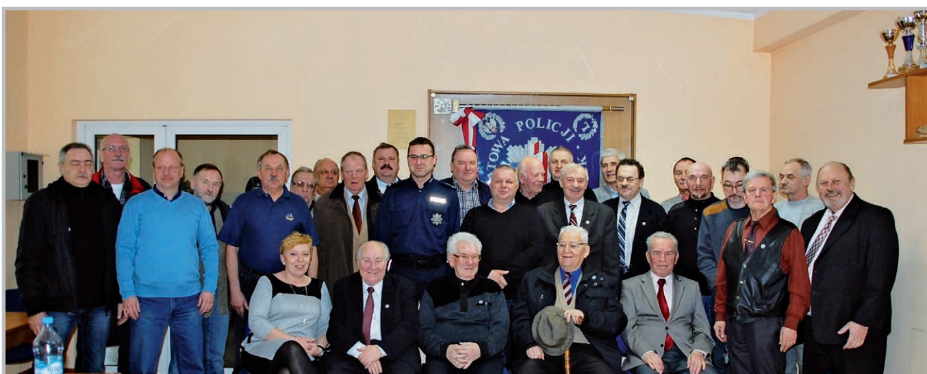
Zebranie sprawozdawcze koła w Pucku