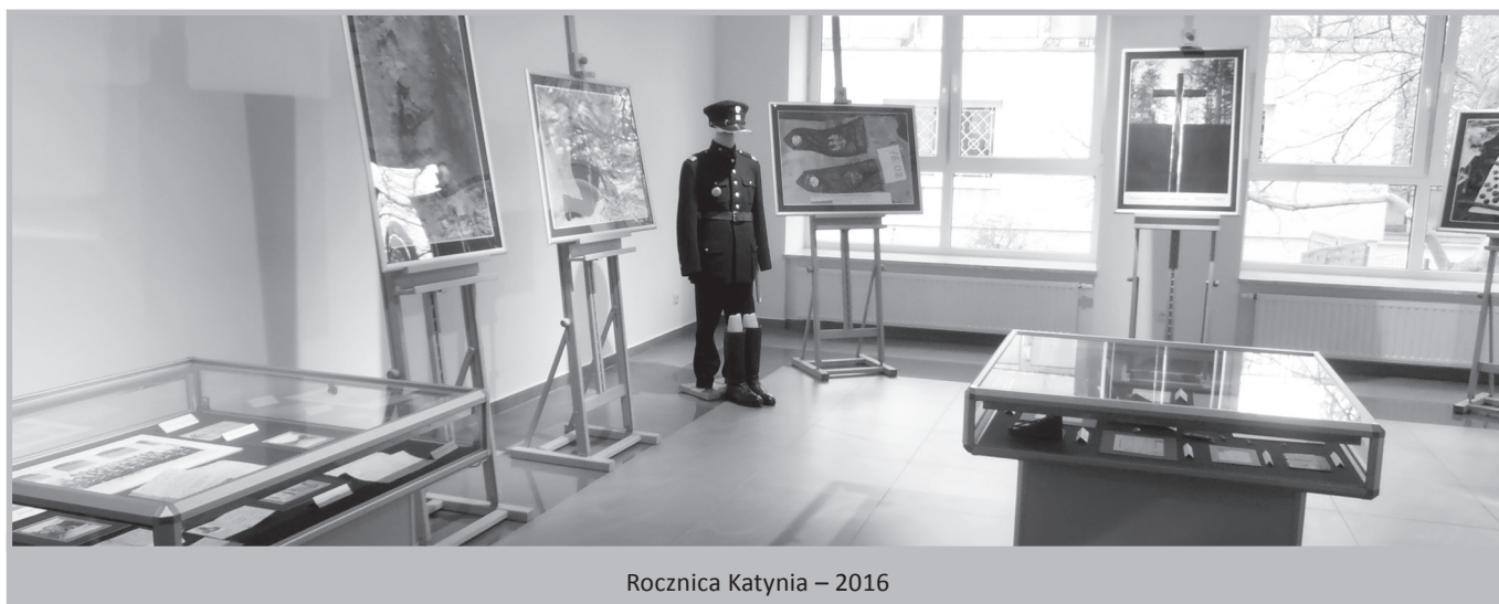
Rocznica Katynia – 2016