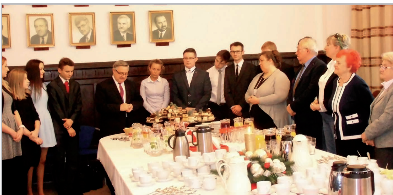
Spotkanie pokoleń w Mysłowicach