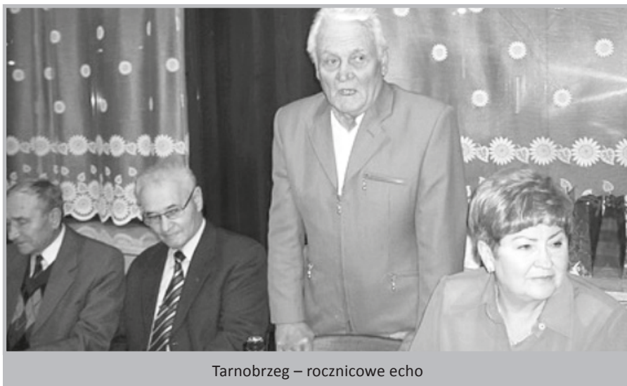
Tarnobrzeg – rocznicowe echo

Swobodna atmosfera spotkania, w przeciwieństwie do jazgotu w przestrzeni publicznej o aktualnej sytuacji w kraju, sprzyjała formułowaniu wielorakich opinii o roli i funkcjonowaniu Stowarzyszenia. Najbardziej