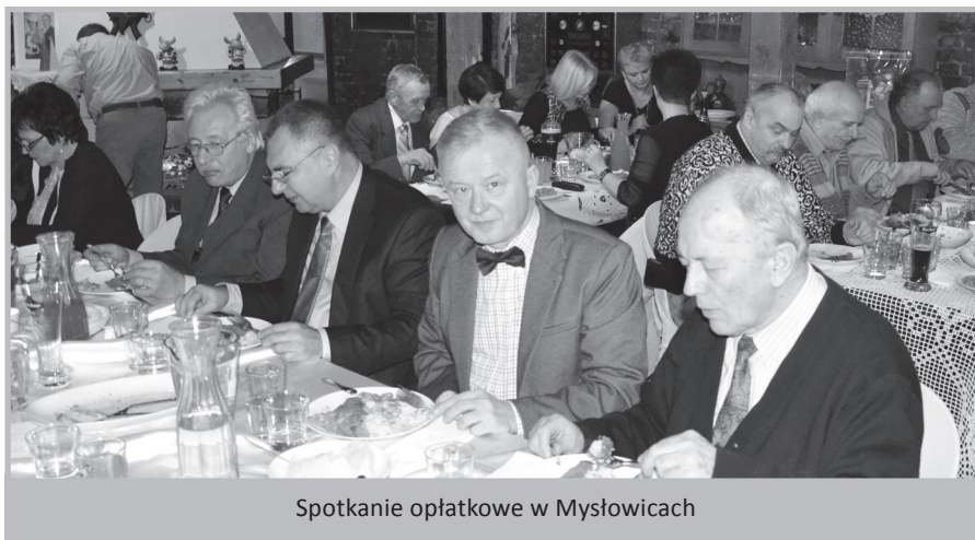
Spotkanie opłatkowe w Mysłowicach

Chorzowskiej Rady Seniorów, jednocześnie życzymy wielu sukcesów.