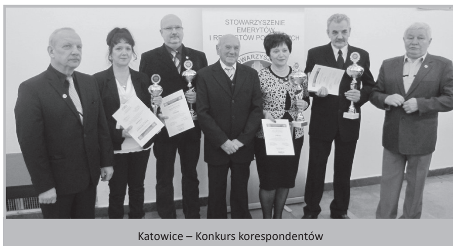
Katowice – Konkurs korespondentów