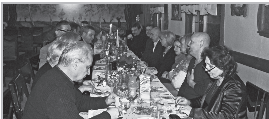
Sochaczew – spotkanie wigilijne