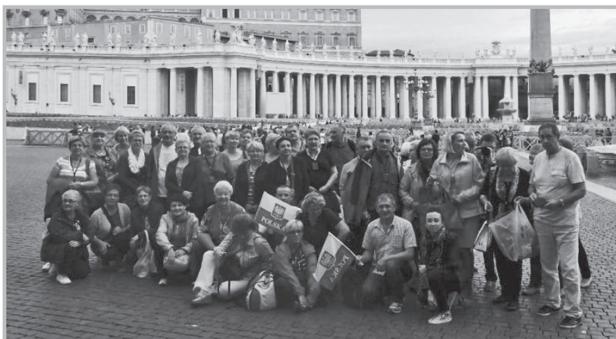
Z Białej Podlaskiej do Włoch