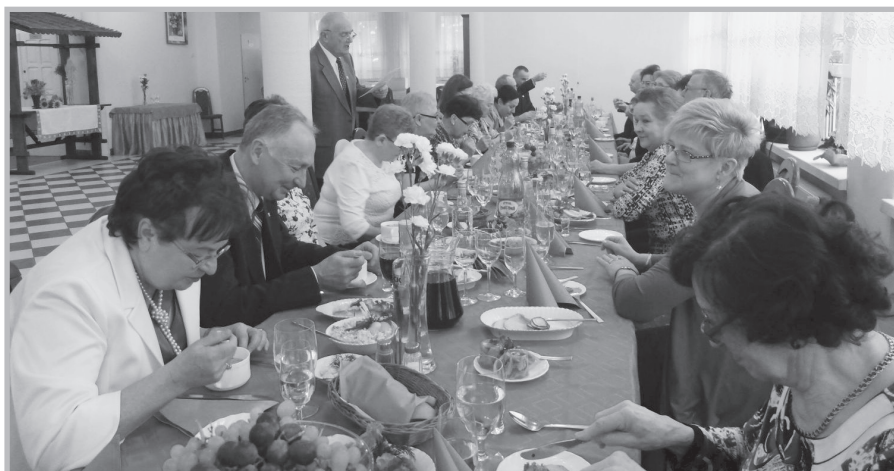
Dzień Kobiet w Białej Podlaskiej

W spotkaniu oprócz członków naszego Koła wzięli udział zaproszeni goście: wiceprzewodniczący NSZZ Policji przy KMP w Białej Podla-