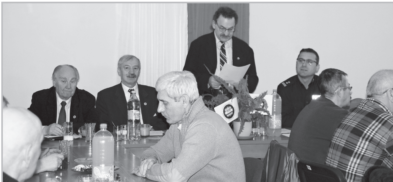
Spotkanie wigilijne w Kościerzynie

liczyć. Na zakończenie złożył życzenia z okazji zbliżających się Świąt Wielkanocnych.