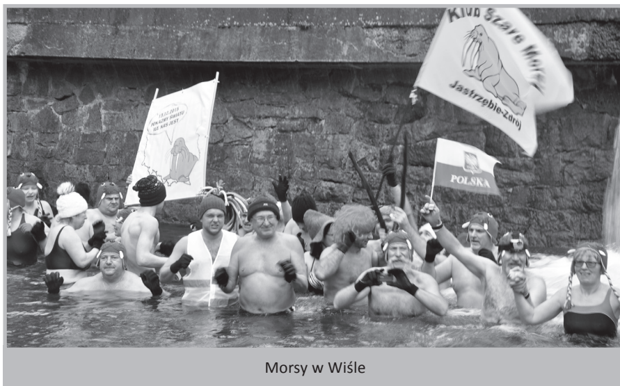
Morsy w Wiśle

no 6 nowych członków koła, które aktualnie liczy 92 członków zwyczajnych i 2 honorowych.