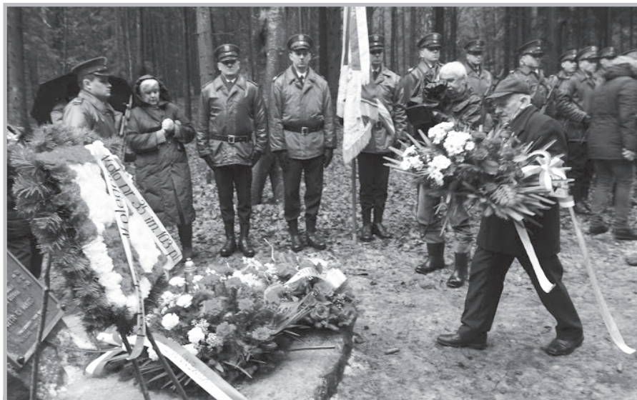
Cisna – upamiętnienie ofiar katastrofy śmigłowca