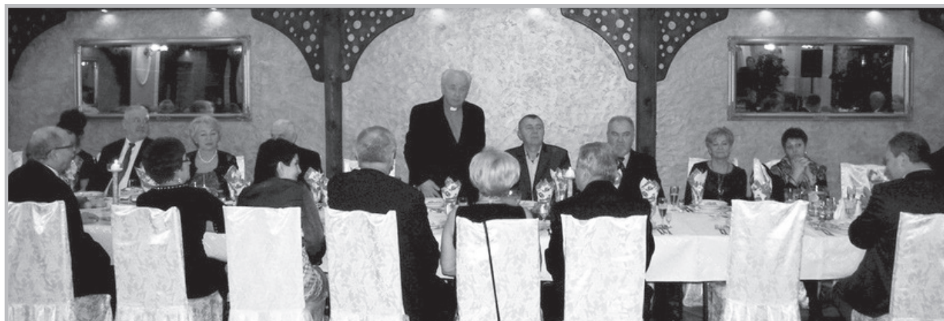
Brzeg – opłatek