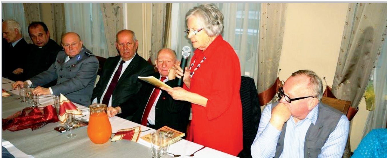
Spotkanie opłatkowe w Rzeszowie