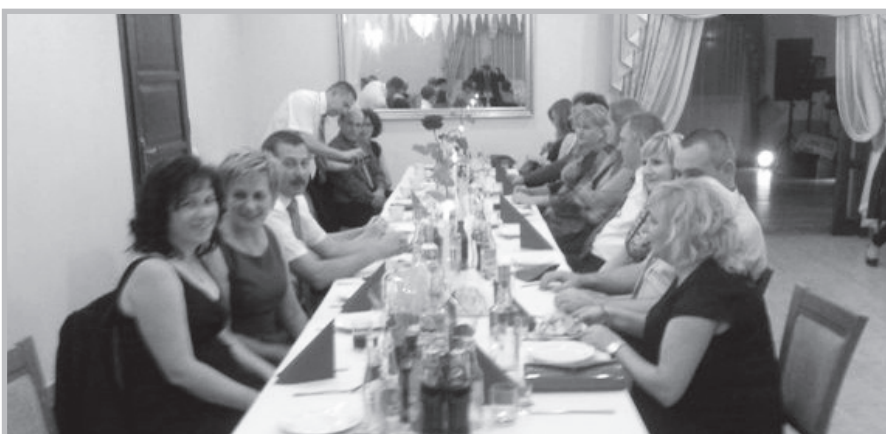
Lubaczów – Andrzejki