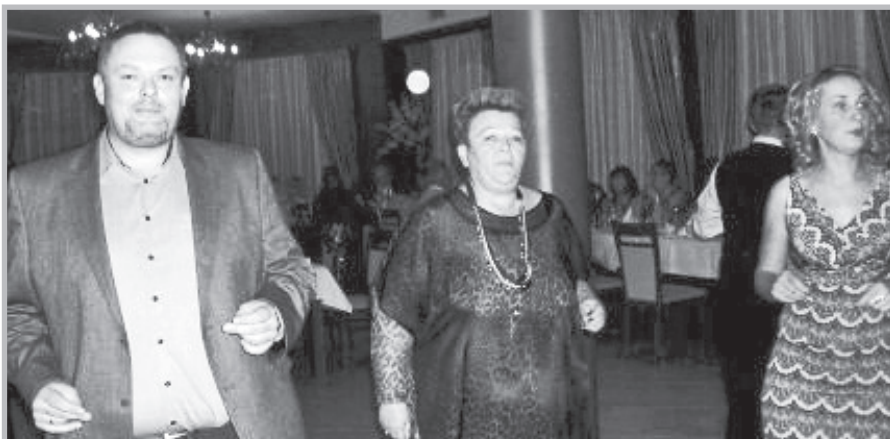
Tarnobrzeg – Andrzejki

15 stycznia 2016 r. odbyło się zebranie sprawozdawcze w kole SEiRP w Sanoku. Na zebraniu zostały wrę-