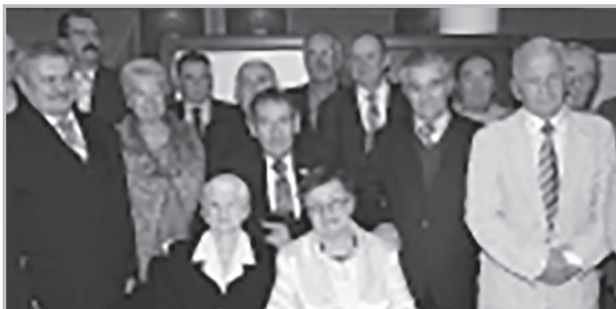
Srebrny jubileusz w Lubartowie