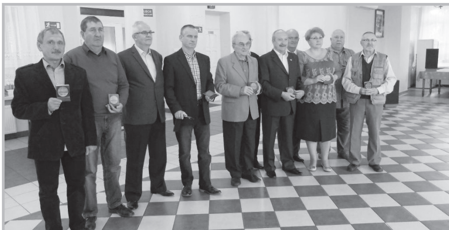
Osiemnaście lat koła w Białej Podlaskiej