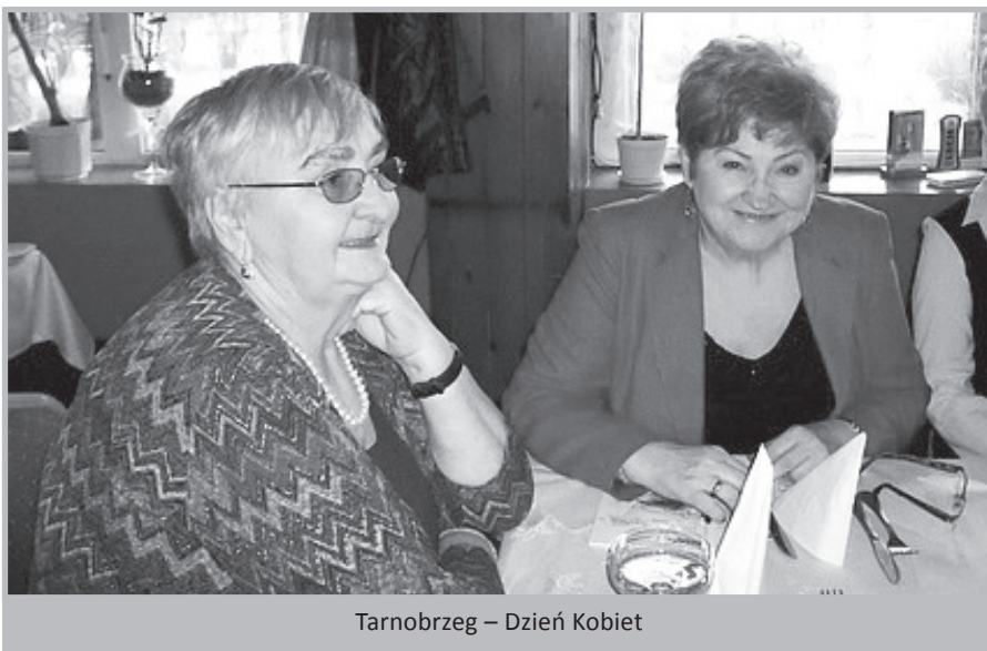
Tarnobrzeg – Dzień Kobiet

Dalsza część spotkania, to rozmowy przy poczęstunku, koncentrujące się na minionym czasie pracy zawodowej, życiu osobistym i rodzinnym sprzed lat i dzisiejszym. Wymieniano także poglądy o współcześnie następujących po sobie zjawiskach społecznych i politycznych w Polsce. Nie ukrywano zaniepokojenia z powodu okazywania przez niektórych polityków rządzącego obozu pogardliwego stosunku wobec ludzi