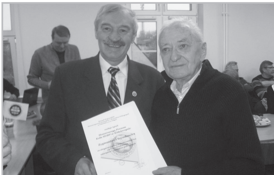
Walne Zebranie członków koła SEiRP w Kościerzynie