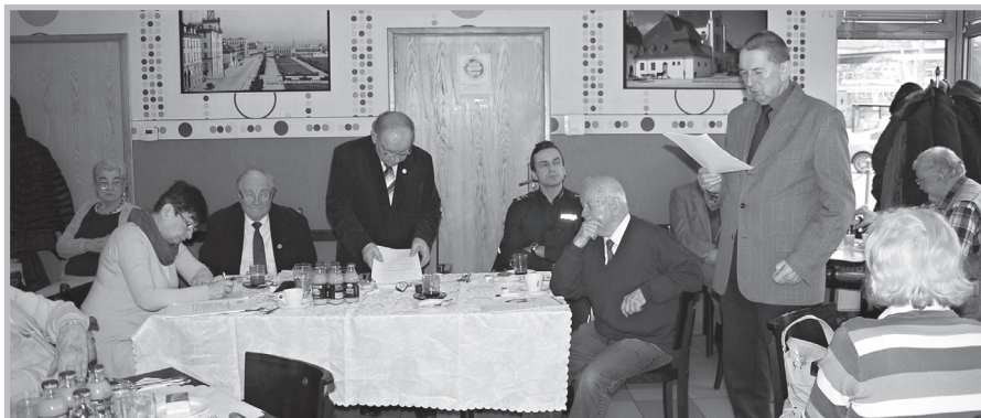
Zebranie sprawozdawcze SEiRP w kole gdyńskim