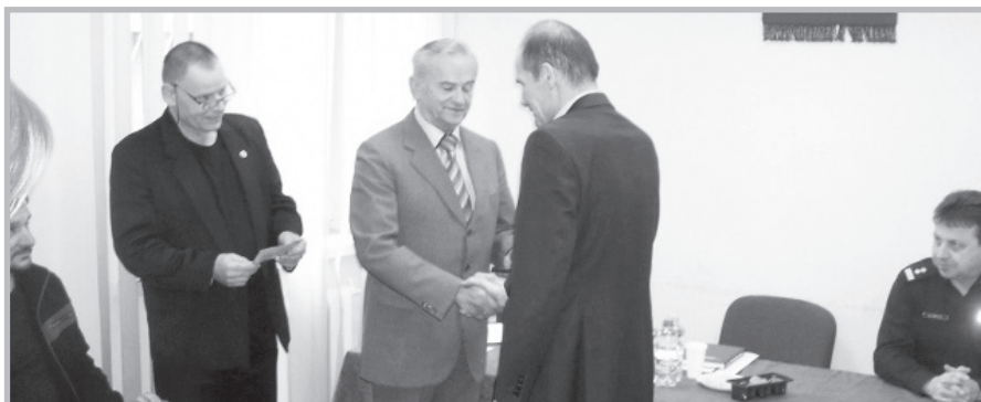
Sochaczew – Walne Zgromadzenie