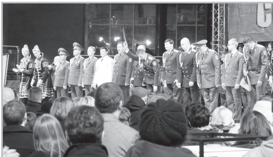
Biała Podlaska – wypad na chór Aleksandrowa