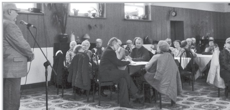
Ruda Śląska – spotkanie środowisk emeryckich

Przedstawili oni zebrany informację o celach statutowych SEiRP, podejmowanych działaniach oraz