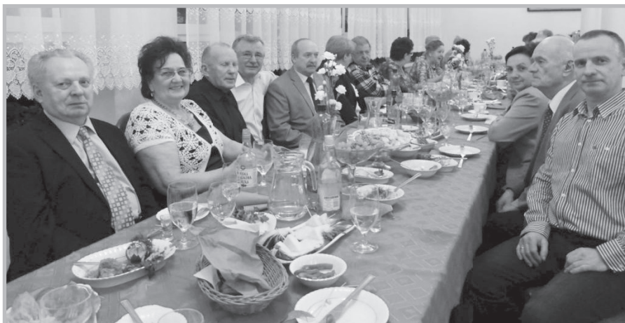
Zebranie sprawozdawcze w Białej Podlaskiej

Spotkanie z okazji Dnia Kobiet. Przy muzyce i poczęstunku z lampką szampana, męska część Zarządu Koła SEiRP w Białej Podlaskiej podejmowała 9 marca 2016 r. członkinie koła