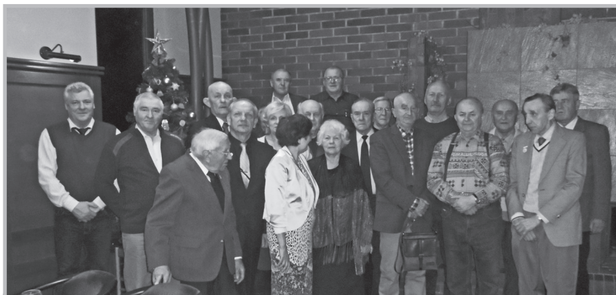
Spotkanie noworoczne w Tychach

złożyli propozycję nawiązania i zacieśnienia współpracy. Inicjatywa spotkała się z przychylnym nastawieniem. Konkrety zostaną ustalone w trakcie kontaktów roboczych, zaplanowanych na styczeń 2016 r.