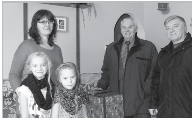
Brzeg – świąteczne paczki