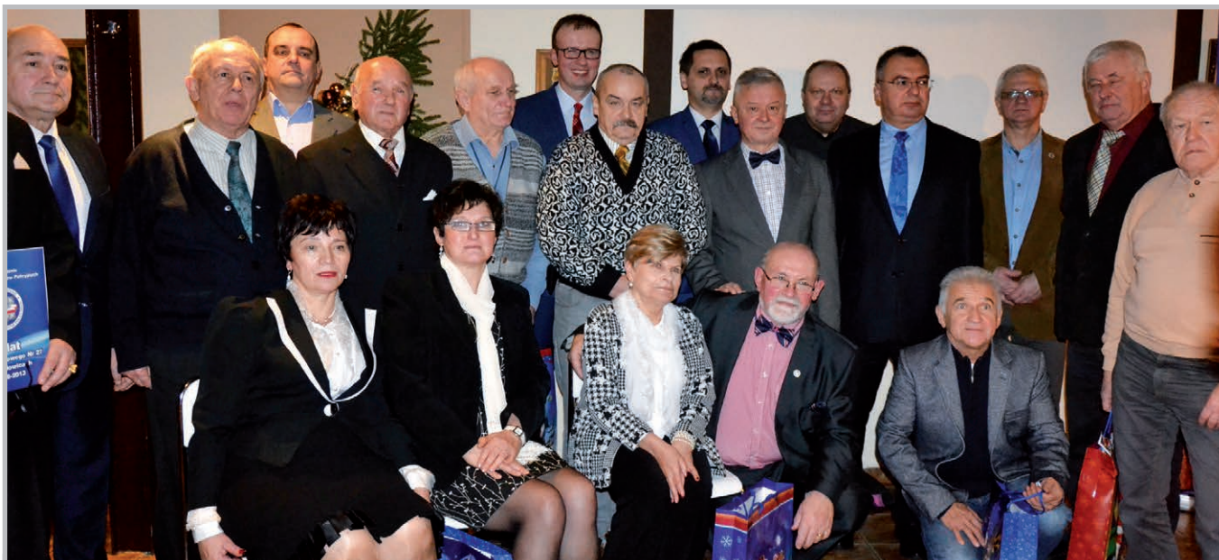
Spotkanie opłatkowe w Mysłowicach