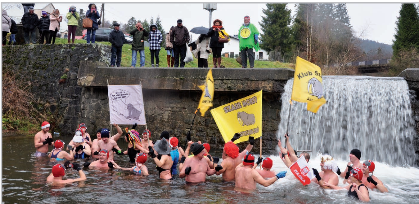
Bicie rekordu Guinness'a w Wiśle