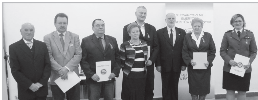
Obrady ZW w Katowicach – 15.03.2016