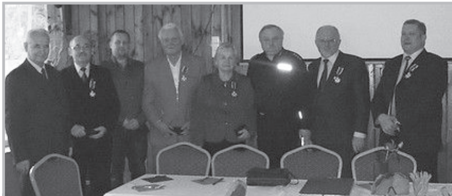
Tarnobrzeg – spotkanie