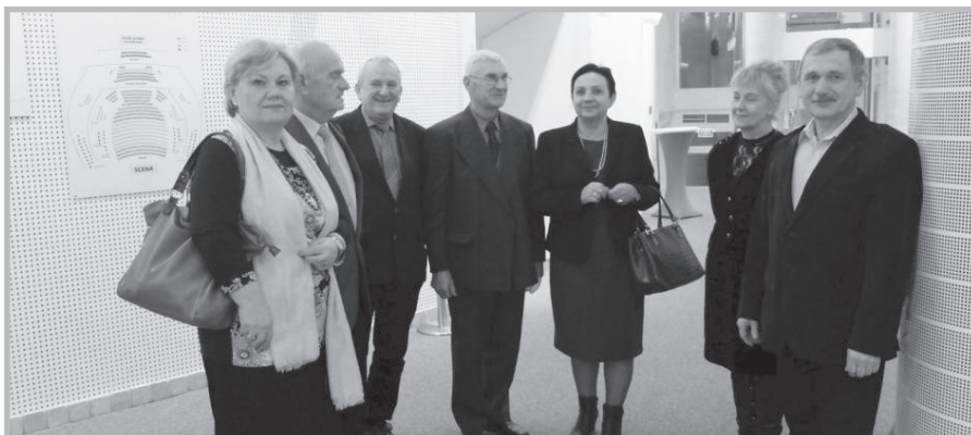
Podziwialiśmy balet narodowy Gruzji

Srebrny Jubileusz powstania obchodziło 18 grudnia 2015 roku Koło SEiRP w Lubartowie. Z tej okazji zarząd koła zorganizował uro-