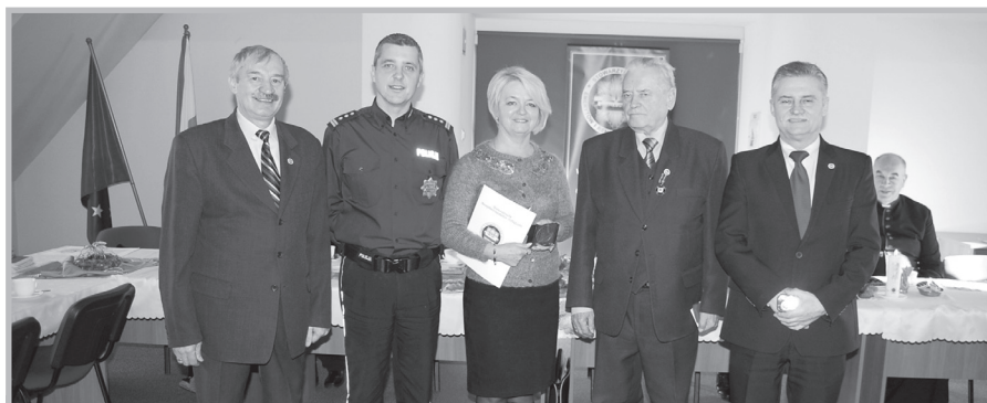
Uroczyste zebranie ZW SEiRP w Gdańsku