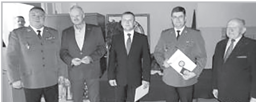
Rzeszów – spotkanie noworoczne ZW