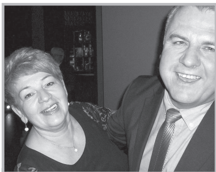
Tarnobrzeskie SEiRP – integracja

Święto Pań w Tarnobrzegu. Tegoroczne święto Dnia Kobiet – zgromadziło liczną grupę pań – emerytek i rencistek policyjnych, członkiń tarnobrzeskiego koła SEiRP. Prezes zarządu koła przywitał zacne grono matek i babć, eksponując ich rolę w przeszłości i teraźniejszości życia rodzinnego oraz publicznego.