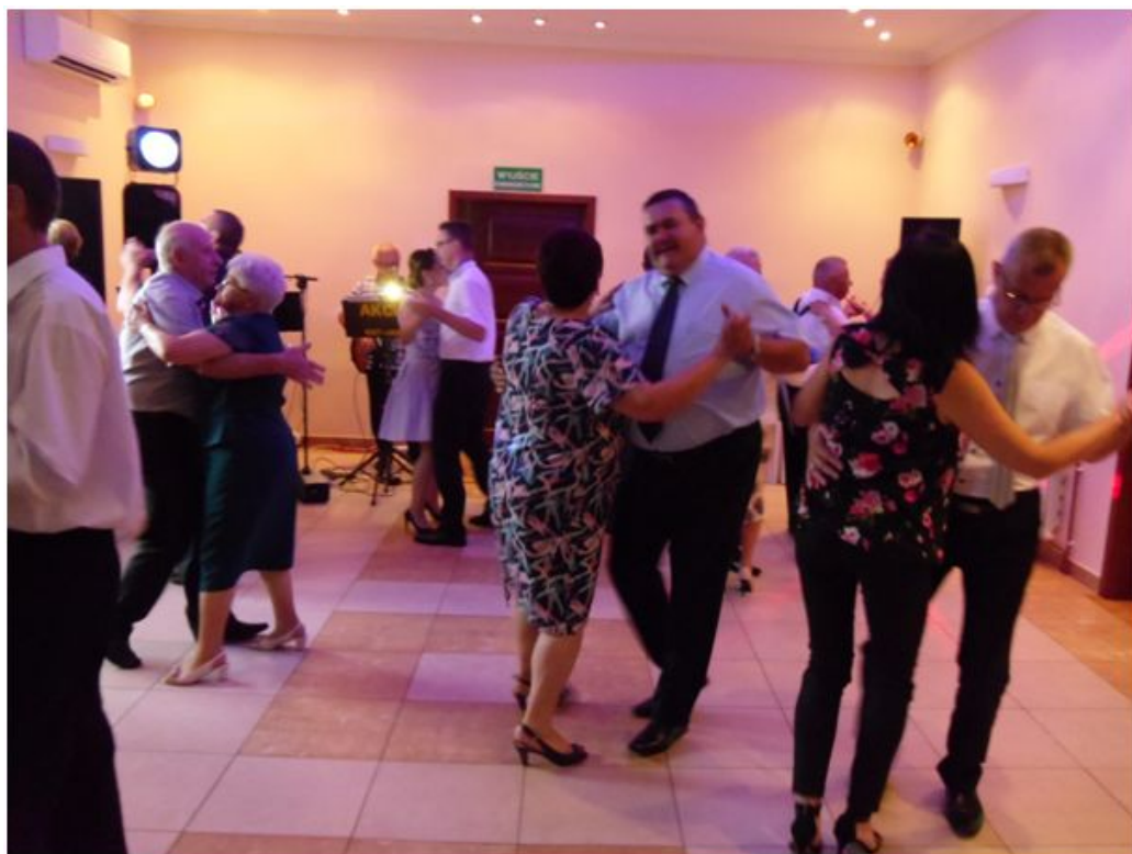
Autor: Marek Kisz