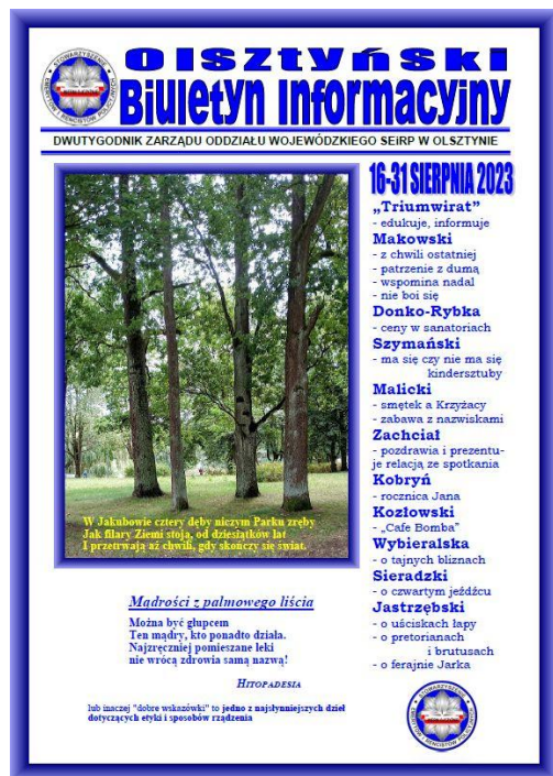
Olsztyński Biuletyn Informacyjny (165)

Zarząd Wojewódzki SEiRP w Olsztynie od 21 maja 2010 r. wydaje "Olsztyński Biuletyn Informacyjny"