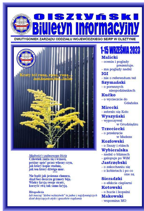
Olsztyński Biuletyn Informacyjny (166)

Archiwum Olsztyńskiego Biuletynu Informacyjnego ZOW Olsztyn znajduje się w sieci na stronie WWW: seirp.olsztyn.pl